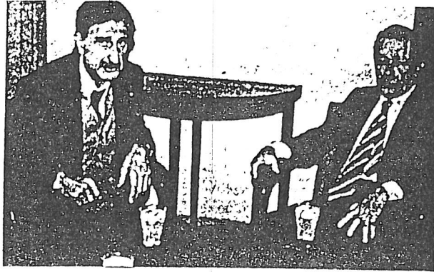
Avec Kamal Joublat.